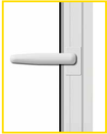
Der Flügel ist in Drehstellung