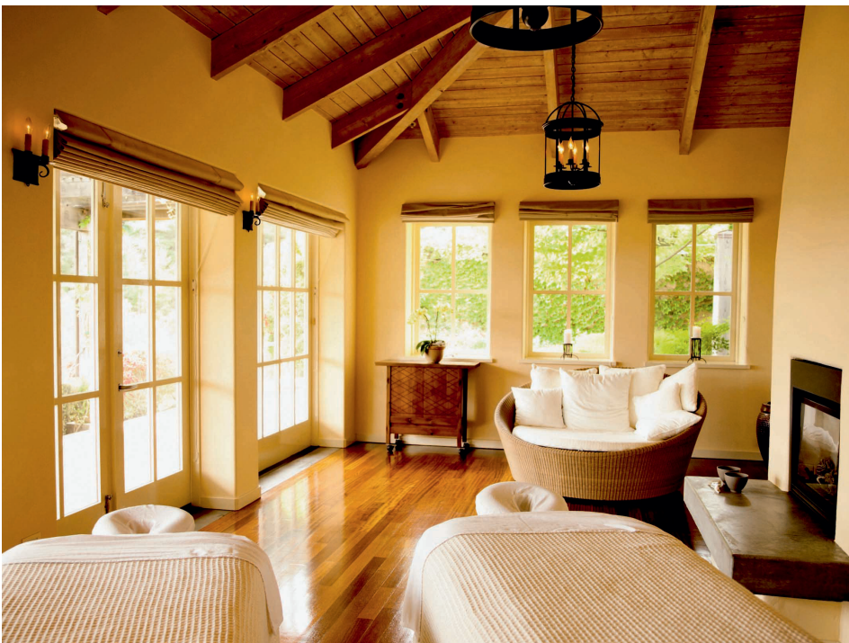
Die spezielle perfecta ThermoVerglasung lässt reichlich Sonnenlicht in Innere. Die zusätzliche, natürliche Wärme begünstigt wohlige Raumtemperaturen und hilft, den Heizaufwand zu verringern. 022 01

! Diese Textversion sowie zwei weitere Versionen können Sie im Internet herunterladen.